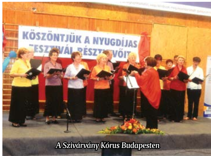
A Szivárvány Kórus Budapesten

könnyűzene kategóriát három kórus képviselte. Kórusunk a világ és magyar könnyűzene három gyöngyszemét énekelte: Luis Armstrong: Szép világ,