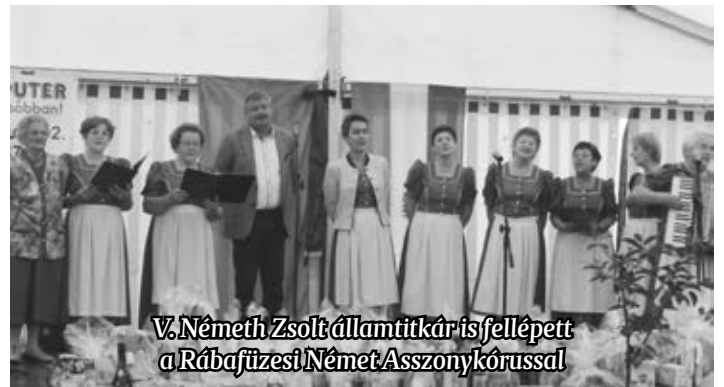
V. Németh Zsolt államtitkár is fellépett a Rábafüzesi Német Asszonykórusal

A találkozó előtt pitesütő versenyre nevezhettek a bátrabb háziasszonyok és urak. Rengeteg süteményt hoztak a rendezvényre érke-