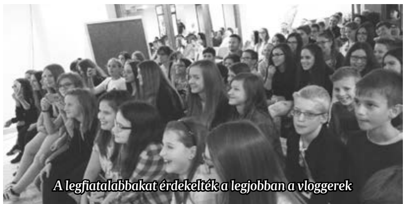
A legfiatalabbakat érdekelték a legjobban a vloggerek