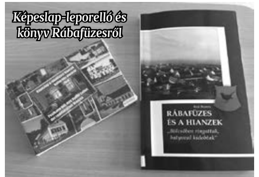
Képeslap-leporelló és könyv Rábafüzesről