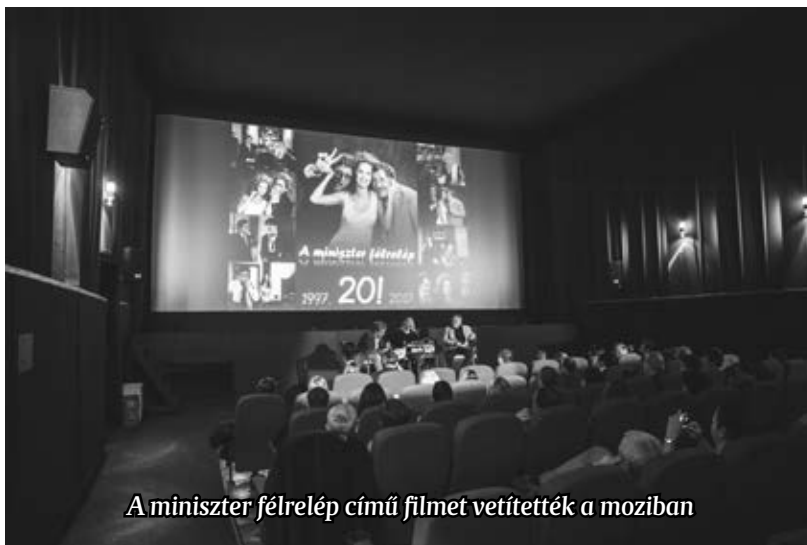
A miniszter félrelép című filmet vetítették a moziban

Sztoriként emlékeztek arra, hogy annál a jelenetnél, amikor az egyik szereplőnek ki kellett repülnie a tolokocsijából a cukorból készült „üvegablakon át”, a filmforgatási műszak legizmosabb emberei sem tudták úgy meglökni, hogy áttörje az „üveget”. Mire