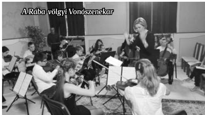
A Rábavölgyi Vonósenekar