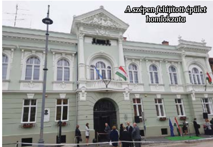
A szépen felújított épület homlokzata