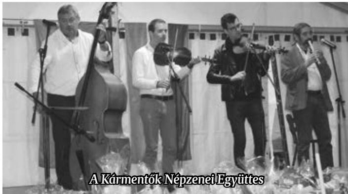
A Kármentők Népzenei Együttes

A Szentgotthárd-Rábafüzes Német Nemzetiségi Önkormányzat ötödik alkalommal rendezte meg a Nemzet napja – nemzetiségi napot Rábafüzesen, ahová ezúttal is gazdag műsorral várták a közönséget szeptember 16-án. Többször eleredt az eső, a rendezvénysátor megvédte a közönséget.