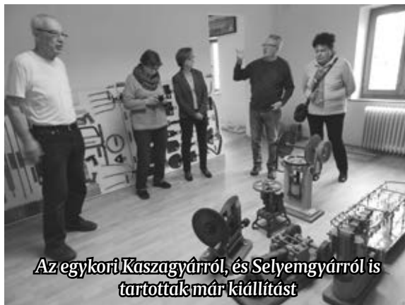
Az egykori Kaszagyárról, és Selyemgyárról is tartottak már kiállítást

A hagyományos kiállítás mellett virtuális kiállítást is tervez az intézmény. A virtuális kiállítás lehetőséget nyújt